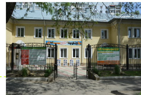
ГБУСО "Невинномысский КЦСОН"

Для получения услуги «Социальная няня» необходимо обратиться в ГБУСО «Невинномысский КЦСОН» С 8.30 до 17.30, перерыв с 13.00 до 14.00, ежедневно, кроме субботы и воскресенья Наш адрес: ул. Маяковского дом 5 Телефоны для справок: 6-40-17